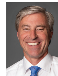
Premier ministre L'honorable Tim Houston

Élue par tous les députés, la présidente dirige les débats conformément aux règles et aux pratiques de l'Assemblée législative et, en cas de partage des voix, c'est elle qui a la voix prépondérante. La présidente est également chargée d'administrer une vaste gamme de programmes liés à l'Assemblée législative et de fournir des services aux députés.