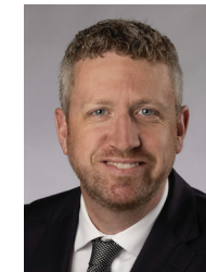
Chef intérimaire du Parti libéral L'honorable Iain Rankin

La présidente vous souhaite la bienvenue à l'Assemblée législative et vous demande d'observer les règles de la tribune à la page suivante.